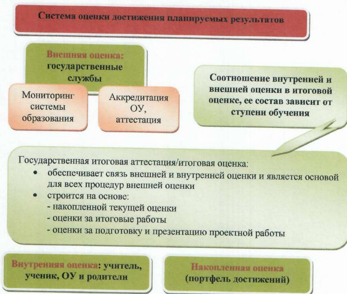
Рис. 2. Система оценки достижения планируемых результатов

Государственная итоговая аттестация/итоговая оценка: